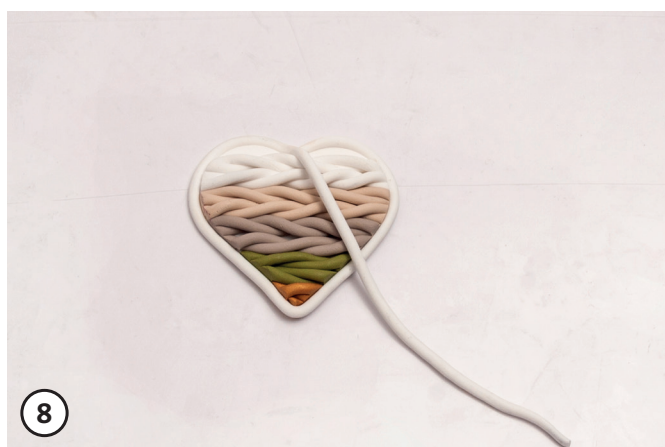
8 Sortez le cordon (fimo) en tricotant le cœur ainsi qu'une ficelle et appuyez dessus. Pour accrocher faire un trou avec un bâton en bois. Poser tous les modèles en pâte polymère sur une plaque de cuisson avec du papier sulfurisé. Faire cuire à 110 ° C, env. 30 minutes au four. Sortez du four, laissez sécher à l'air. Le pendentif en tricot (Fimo) peut être accroché avec du ruban adhésif décoratif sur le verre ou sur une branche.