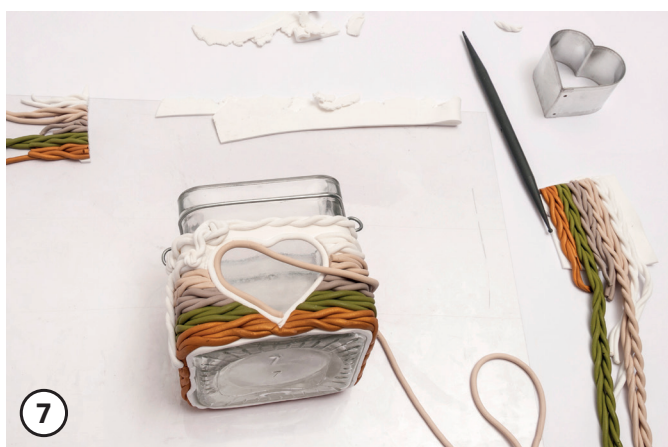
7 Couvrir le bord du motif avec un cordon en pâte polymère.