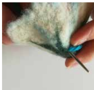
20. A l'aide de l'aiguille Smyrna, guidez les deux extrémités de la laine (perle à l'intérieur de la fleur) vers l'extérieur à travers ce trou.