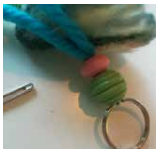
28. Enfilez les perles sur le fil, guidez le fil à travers l'anneau fendu et repassez-le dans les perles.