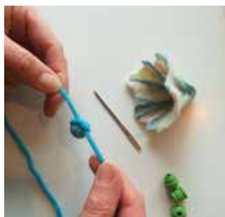
18. Fixez la perle au milieu avec un nœud.