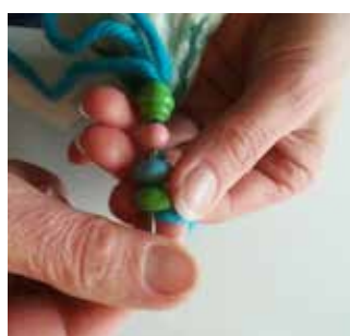
23. Passez la deuxième extrémité de la laine dans les perles de la même manière.