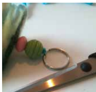
29. Rentez le bout du fil à l'intérieur de la fleur, nouez-le et coupez-le.