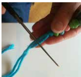
25. Coupez les extrémités de la laine.