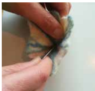
19. Percez un trou au milieu de l'intérieur de la fleur avec l'aiguille picotante.