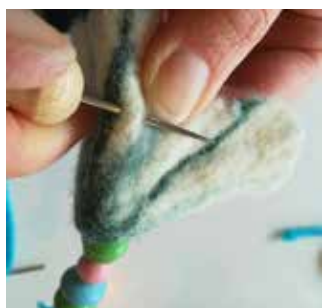
26. À l'opposé du collier de perles, passez un autre fil de laine à travers la fleur de l'intérieur vers l'extérieur. Utilisez du piquant et une aiguille de Smyrne.