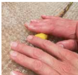
11. En frottant, avec et sans papier d'aluminium, mouledez la forme de la tête.