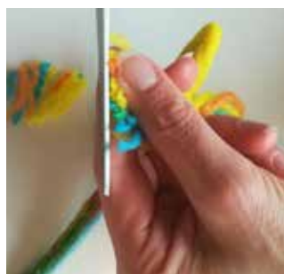
16. Coupez les cheveux en forme.