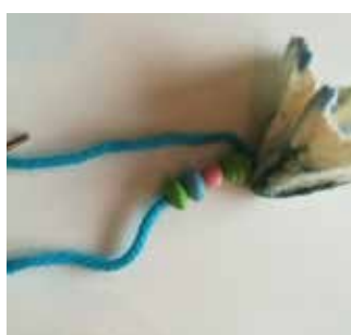
22. Enfilez des perles sur une extrémité de la laine.