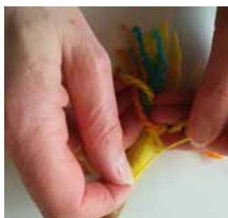
15. Nouez ensemble les deux extrémités du fil. Coupez le fil restant.