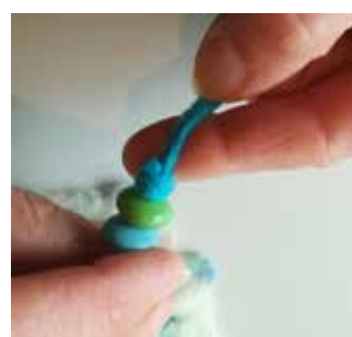
24. Nouez les deux extrémités de la laine après les perles.