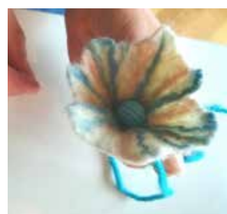
21. La perle se resserre à l'intérieur de la fleur.