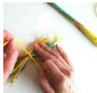
13. Nouez les morceaux de laine ensemble au milieu à l'aide d'un fil de laine supplémentaire.