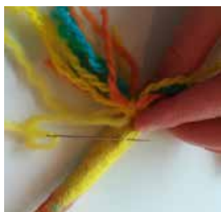
14. Enfilez une extrémité du fil sur l'aiguille Smyrna. Percez un trou dans la tête avec l'aiguille picotante. Guidez l'extrémité du fil à travers le trou.