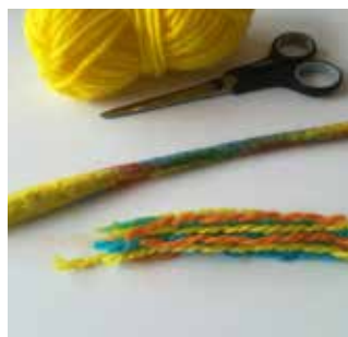
12. Pour les cheveux, séparez les morceaux de laine dans les couleurs (jaune, orange, bleu, vert). Longueur chacun environ 12 cm.