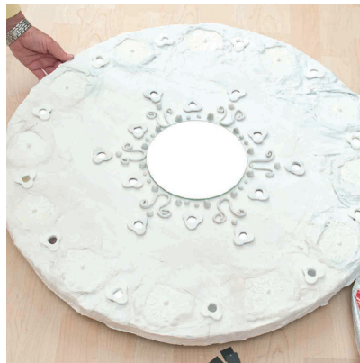
Illustration du point 17.

17. Maintenant, vous fixez les mosaïques miroir entre les ornements tamponnés et les fioritures modelées.