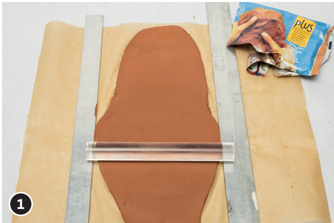
1 Avec la terre souple SIO-2 plus, l'une de couleur blanche et l'une de couleur terre cuite, aplatir deux plaques de terre d'env. 8 mm d'épaisseur.