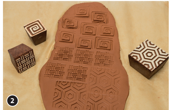
2 Avec le bloc de gaufrage, imprimer différents motifs dans la terre.