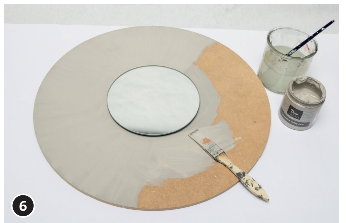
6 Mettre une couche de fond de couleur gris pierre avec la peinture Chalky Finish sur la rondelle. Laisser bien sécher la peinture.