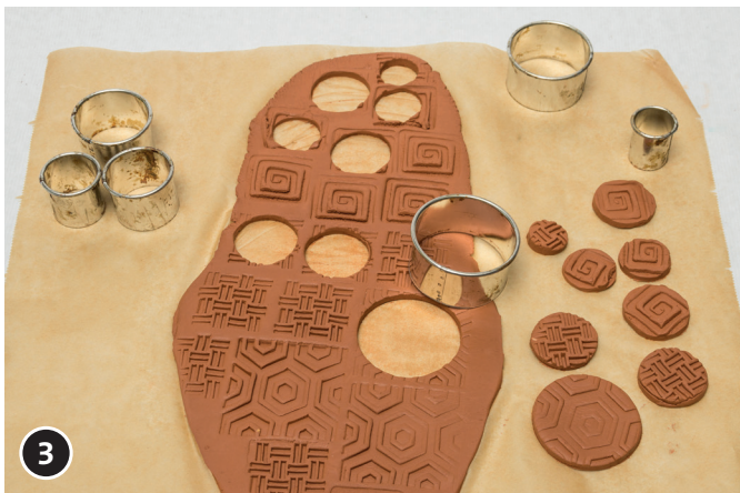
3 Découper différents cercles avec un emporte-pièce Anneau (avec motifs gaufrés). Laisser sécher les motifs en terre durant env. 1 à 2 jours.