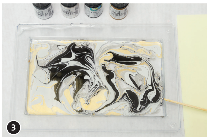
3 Mélanger les couleurs les unes aux autres avec une tige de bambou.