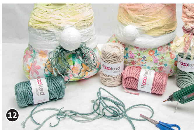
12 Pour le noeud et la moustache, utiliser de la ficelle de jute. Choisir les longueurs souhaitées, découper puis nouer. Vous pouvez aussi utiliser un pistolet à colle chaude (ou simplement de la colle) pour fixer la ficelle.

Amusez-vous bien! Votre équipe créative OPITEC!