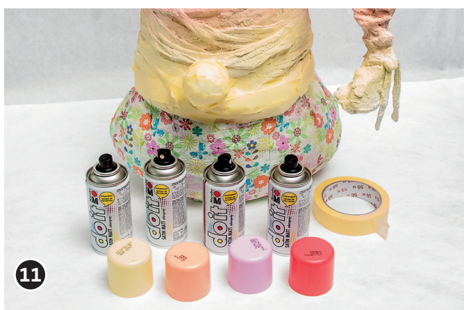
11 Vaporiser de la peinture en spray sur le bonnet du lutin. Laisser sécher pendant une nuit.