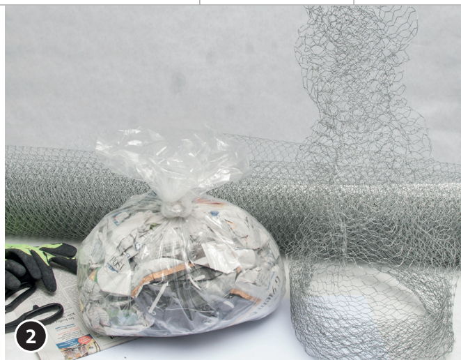
2 Découper un morceau de grillage hexagonal de la taille souhaitée puis le modeler de façon à lui donner une forme de long bonnet de lutin.