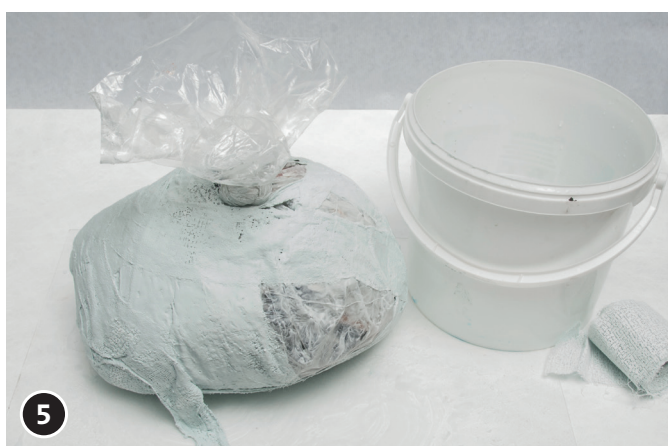
5 Tapisser le corps du lutin (sac en plastique rempli de papier) de bandelettes de plâtre humides. Bien recouvrir toute la surface.