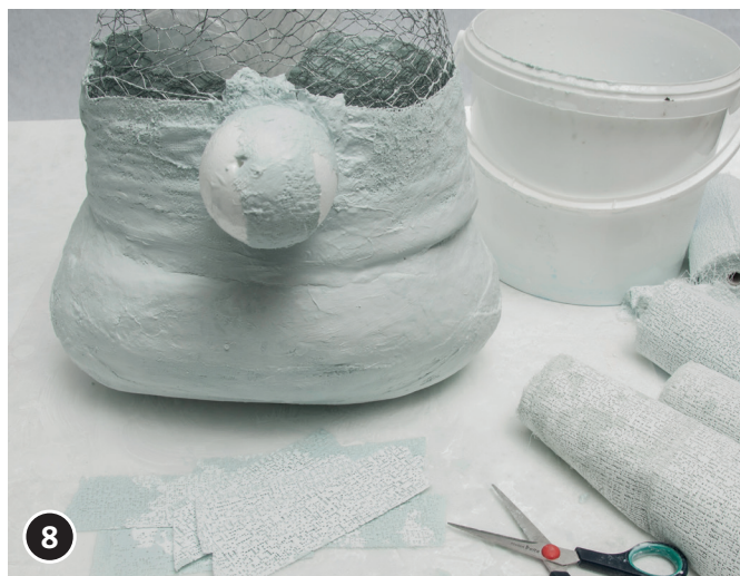
8 A l'aide de bandelettes de plâtre, fixer la boule en polystyrène (qui fera office de nez) au rebord du bonnet.