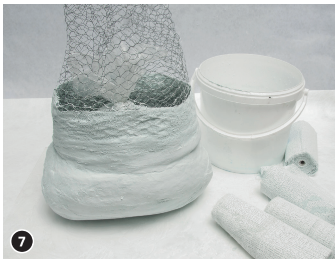
7 Utiliser de nouvelles bandelettes de plâtre pour mieux fixer le corps au bonnet.