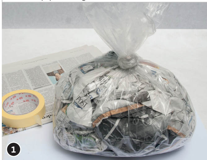
1 Remplir un sac en plastique de vieux papier journal puis faire un noeud. Pour une meilleure tenue, on peut ajouter du sable ou des cailloux.