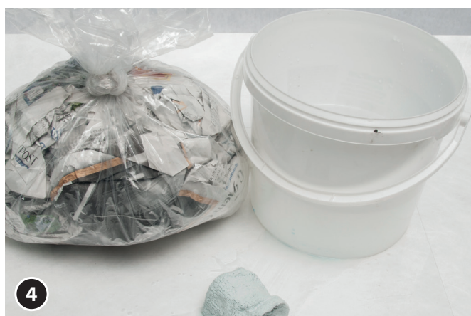
4 Détacher une bandelette de plâtre puis l'humidifier dans un seau d'eau.