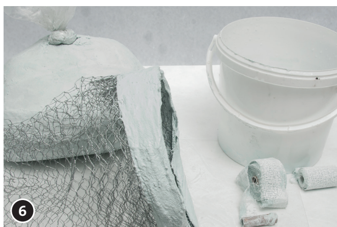
6 Pour une meilleure adhérence du bonnet, appliquer des bandelettes de plâtre humides au niveau de sa bordure inférieure.