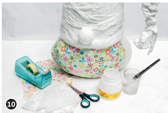
10 Prendre une serviette en papier et en détacher la couche supérieure (celle qui comporte les motifs). Laisser de côté les deux couches restantes. Découper un morceau de serviette de la taille souhaitée. (Évaluer la taille en se basant sur le corps du lutin.) Déposer la serviette (couche supérieure) sur le corps du lutin, verso contre le plâtre et côté imprimé vers l'extérieur. En partant du milieu de la serviette, appliquer précautionneusement la colle transparente à l'aide d'un pinceau plat et souple. Continuer le processus: à l'aide de colle, recouvrir le corps du lutin avec des serviettes à motifs. Laisser sécher la colle pendant une nuit.