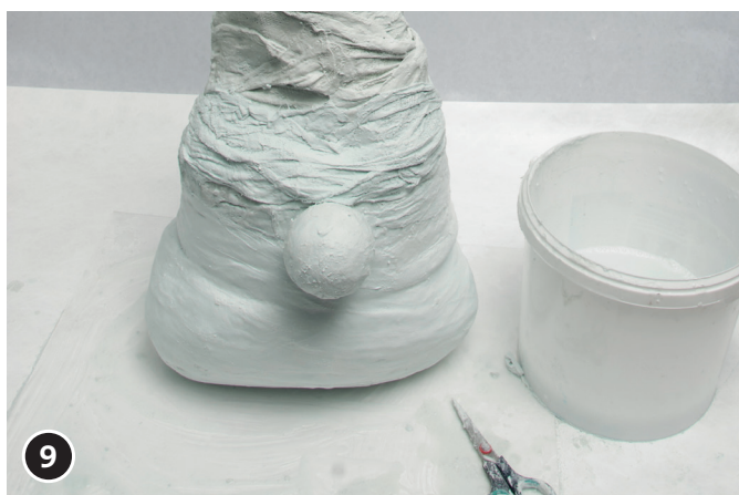
9 Recouvrir une fois encore le bonnet de bandelettes de plâtre. Laisser sécher pendant un jour ou deux.