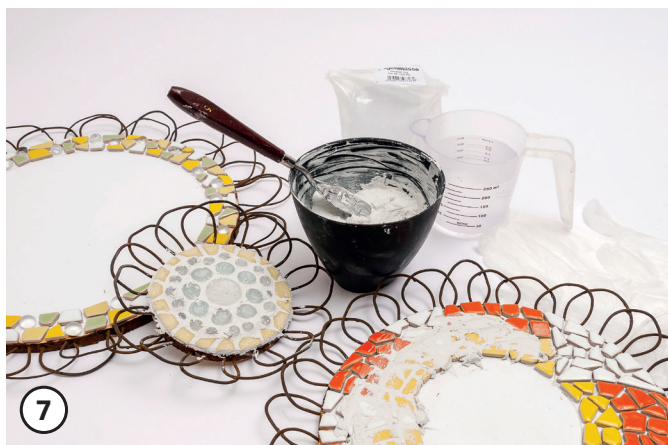
7 Enduire les joints de la mosaïque selon les instructions de base.