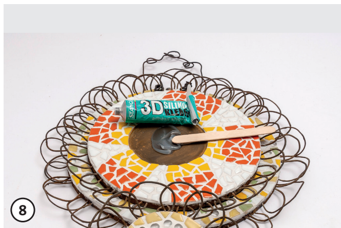
8 Placez les plaques de mosaïque les unes sur les autres et collez-les avec de la colle silicone.

Votre équipe créative OPITEC ! vous souhaite beaucoup de plaisir à la réalisation!