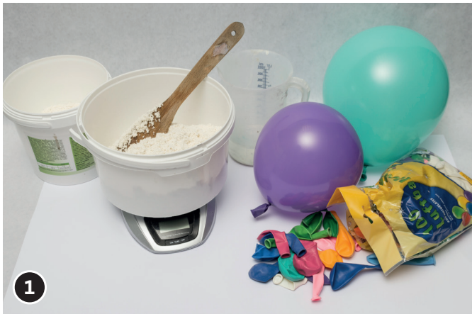
1 Mélanger le papier mâché selon le mode d'emploi du produit, avec de l'eau.