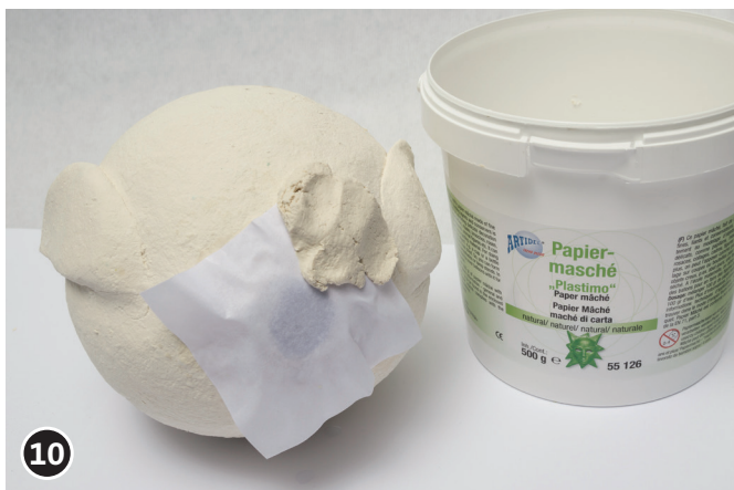
10 Fermer l'ouverture réalisée avec du papier mâché, bien laisser sécher le papier mâché.