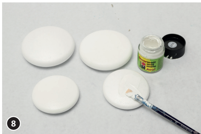
8 Mettre une couche de fond de peinture blanche sur les médaillons en polystyrène.