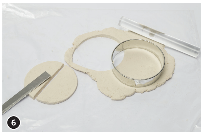
6 Découper un cercle pour les ailes, le séparer en deux.