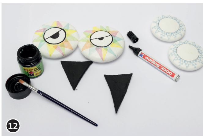
12 Dessiner les yeux avec le feutre edding. Mettre une couche de fond noir pour le bec. Laisser bien sécher la peinture.