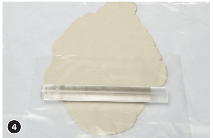
4 Aplatir une plaque de papier mâché sur env. 5 mm d'épaisseur.