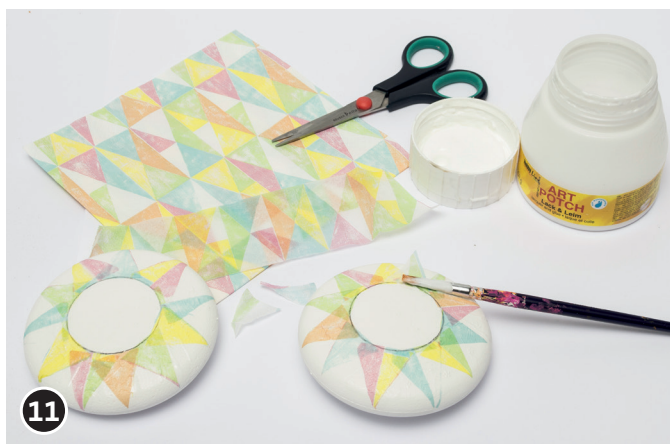
11 Découper la serviette à la forme voulue. Enlever la couche supérieure de la serviette et fixer cette dernière avec de la colle pour serviettes sur les médaillons. C'est-à-dire poser la serviette et enduire la couche supérieure de colle pour serviettes. La colle devient transparente en séchant.