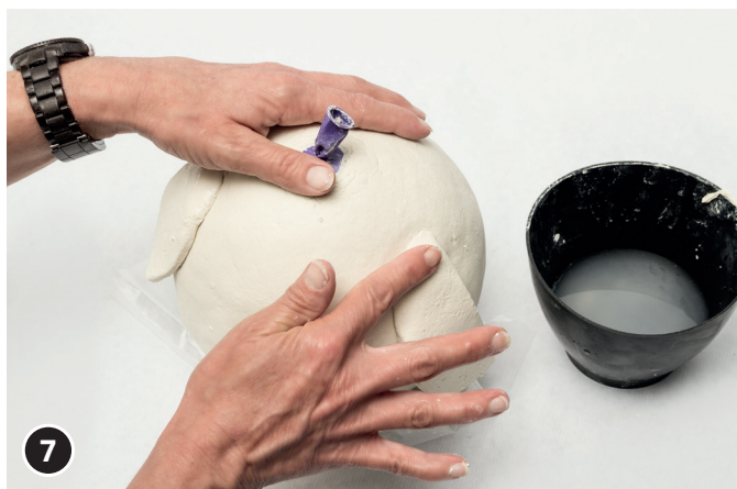
7 Appuyer les ailes avec de l'eau sur le corps de la chouette.