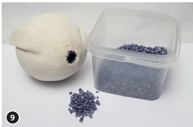
9 Remplir les corps des chouettes avec des petites pierres.